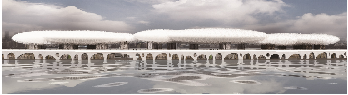
北京奥运公园三馆联合体(二)